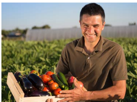
Cueillette de Servigny, 77

Aux portes de l'effervescence agricole francilienne : 12 millions de consommateurs, toujours plus exigeants, curieux et gourmands. Ce pôle présente l'ensemble des bénéfices apportés par l'agriculture francilienne.