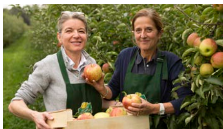
Les 2 Cueillettes de Compans, adhérent Bienvenue à la Ferme, 77